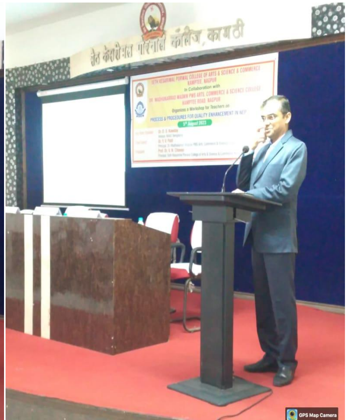
GPS Map Camera Kamptee, Maharashtra, India 6664+88M, near Dragon's palace, Gautam Colony, Kamptee, Maharashtra 441001, India Lat 21.210841° Long 79.205523° 05/08/23 12:22 PM GMT +05:30