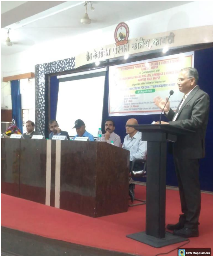
GPS Map Camera Kamptee, Maharashtra, India 6664+88M, near Dragon's palace, Gautam Colony, Kamptee, Maharashtra 441001, India Lat 21.21079° Long 79.205751° 05/08/23 01:44 PM GMT +05:30